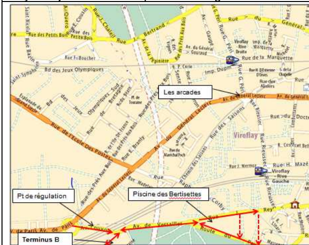
Fig.3 : le bus B continue jusqu'aux Bertissettes puis revient par la rue Louvois ou Nicquet. Pb : voie privées