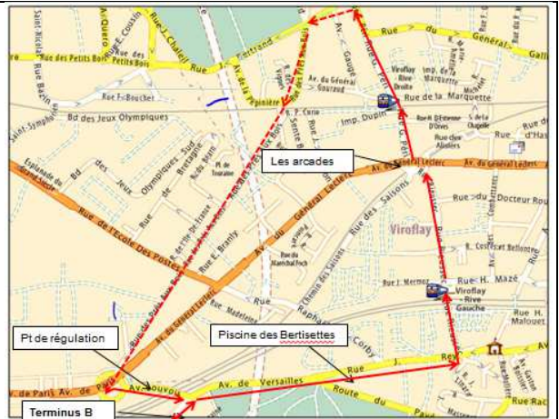
Fig.2 : Du terminus du Bus B, une navette de petit gabarit tourne en boucle pour desservir les 2 gares.