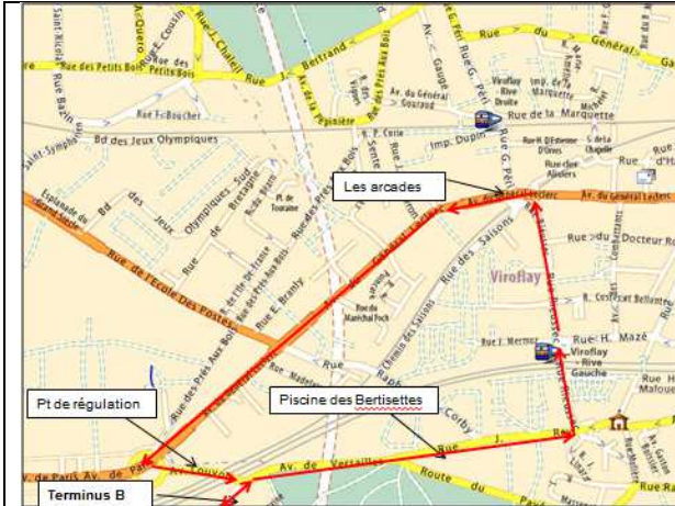
Fig.1 : le bus B continue jusqu'à Viroflay RG par la rue Rey : Trajet naturel mais problème de gabarit.