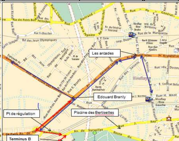
Fig. 4 : le bus D allant vers Viroflay RG fait un détour par la place Louis XIV pour se connecter au BusB.