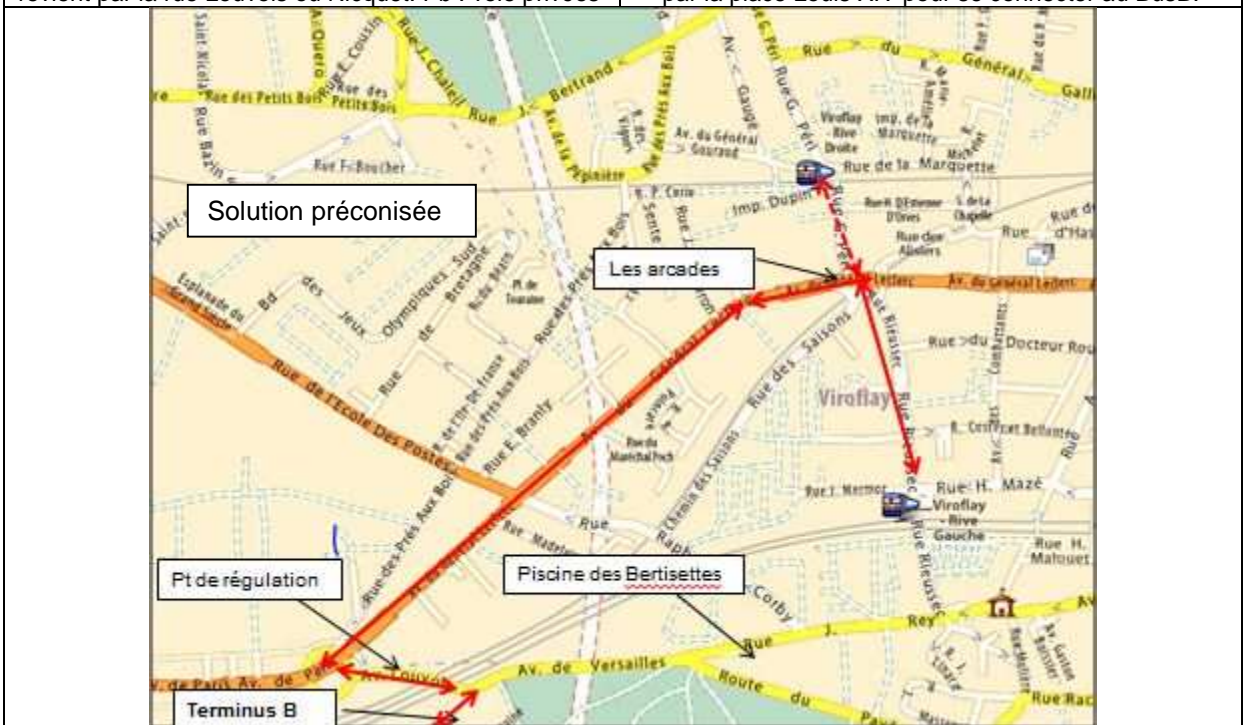
Fig 5 : Le bus B continue par la place Louis XIV et l'avenue du général Leclerc jusqu'à Viroflay RG après un arrêt aux Arcades où il dépose les passagers qui peuvent se rendre à pied à Viroflay RD.